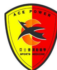
亞士堡國際有限公司