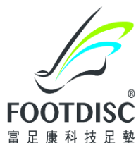
歐利達股份有限公司