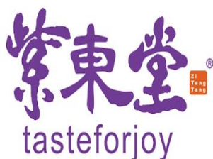
紫東堂科技股份有限公司