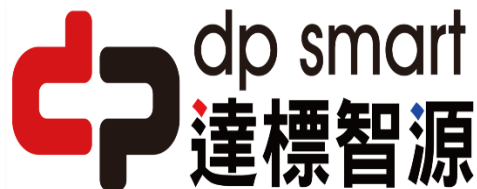
達標實業股份有限公司