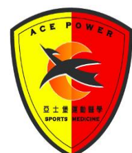
亞士堡國際有限公司