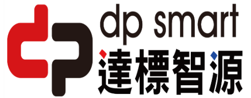
達標實業股份有限公司