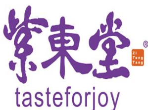
紫東堂科技股份有限公司