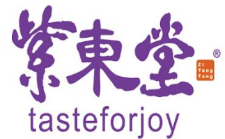
紫東堂科技股份有限公司