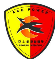
亞士堡國際有限公司