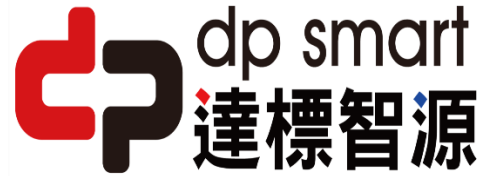
達標實業股份有限公司